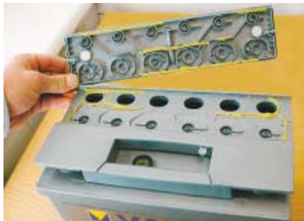
Akkumulator af den lukkede type, der har labyrint i låget, der fortætter dampene til vand igen.

RULLEDE CELLER er som gélebatteriet, der tåler flere dybdeafloadninger, samtidig en bedre lademodtagelighed, på grund af at de rullede celler har større pladeoverflade.